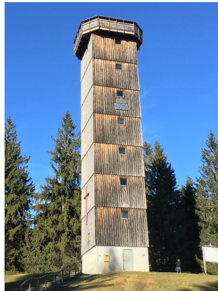
Schwarzer Grat Turm